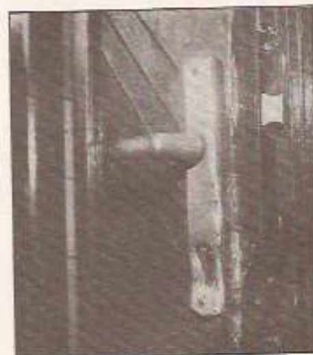
„Zárteltörés módszerével” (archív felvétel)

– A fiatalasszony meggyilkolása mindenkit megdöbbentet, szerencsére a pol-