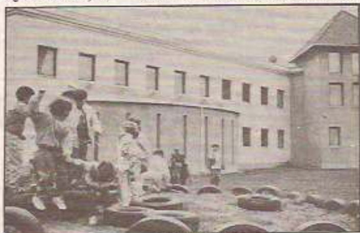
... aztán játszunk

Ha a tavalyi évet nézzük – de előtte is – örömmel mondhatom, hogy minden