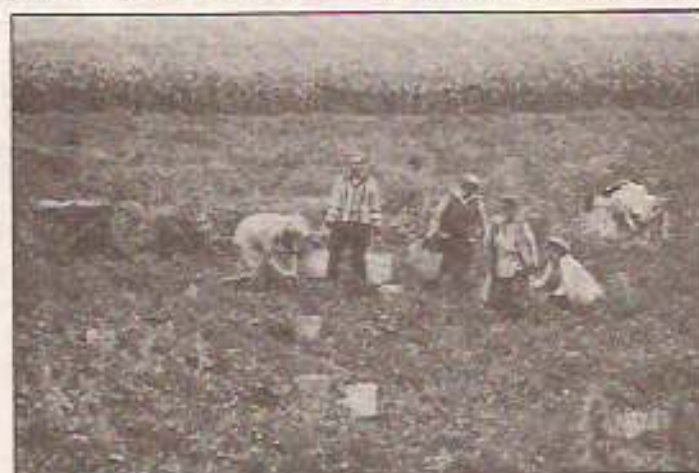
A szorgalmas munka meghozta gyümölcsét.