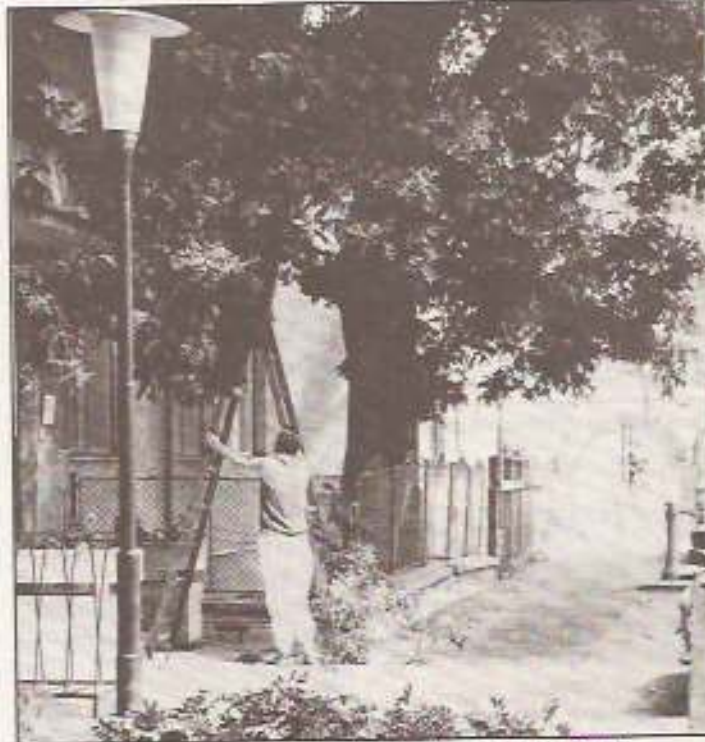
Tavaszi fazonigazítás!

Elballagtak a nyolcadikosok. Névsorukat lapunk 5. oldalán találják