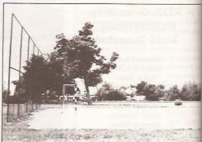
Sportudvar a központi iskolában