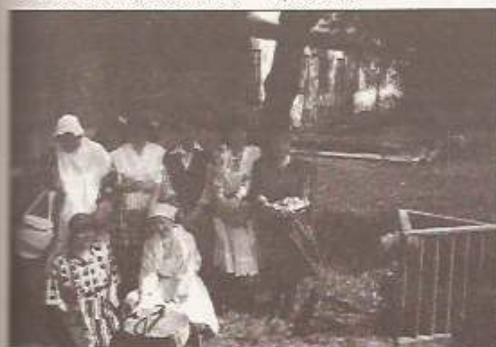
Óvónők a kulturális seregszemlén