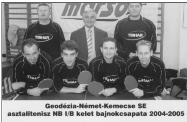
Geodézia-Német-Kemecse SE asztalitenisz NB I/B kelet bajnokcsapata 2004-2005